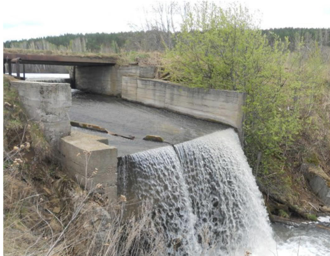
Рис. 4. Водосброс

Примеры отдельных гидротехнических сооружений приведены на рис. 4, 5, 6, 7, 8.