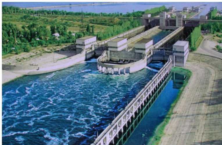
Рис. 5. Судходное гидротехническое сооружение