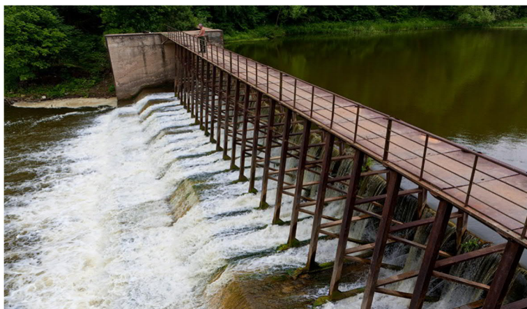
Рис. 6. Плотина. Московская область