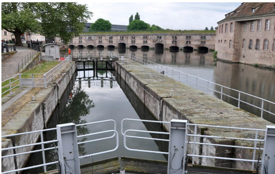
Рис. 8. Шлюз в г. Страсбург

Скорость воды в каналах должна поддерживаться в пределах, не допускающих размыва откосов и дна канала, а также отложения наносов; при наличии ледовых образований должна быть обеспечена бесперебойная подача воды. Максимальные и минимальные скорости воды должны быть установлены с учетом местных условий и указаны в местной инструкции.